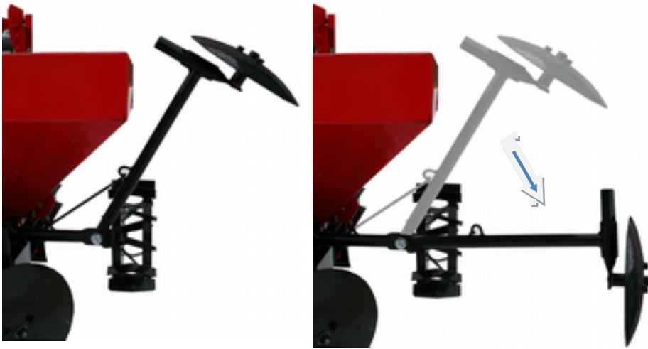
Рис.3. Установка маркёра.

На картофелесажалке КС-2МТ предусмотрен маркёр - приспособление для правильного ведения бороздки посевного агрегата. Маркёр представляет собой штангу, один конец которой шарнирно закрепляют на раме КС-2МТ (под прямым углом к направлению движения), а другой снабжают косо поставленным диском. При движении агрегата диск маркёра образует на поверхности почвы борозду, которая служит ориентиром для направления переднего колеса мини-трактора, или следоуказателя при следующем движении агрегата. Посев производится обычно челночным способом: дойдя до конца поля, агрегат поворачивают и засевают полосу рядом с засеянным полем. Поэтому агрегат примыкает к засеянному полю попеременно то одной, то др. стороной. Вследствие этого маркёры установлены как с правой, так и с левой стороны агрегата. Во время работы маркёр, укрепленный со стороны засеянного поля, поднимают и сцепляют штангу на спец. крючок.