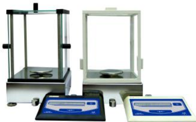
Рисунок 1 – Вид весов (блок весоизмерительный и блок электронный) с разными ветрозащитными витринами.