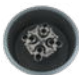
8 × 50 мл