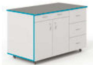
Стол� лабораторные закрытые