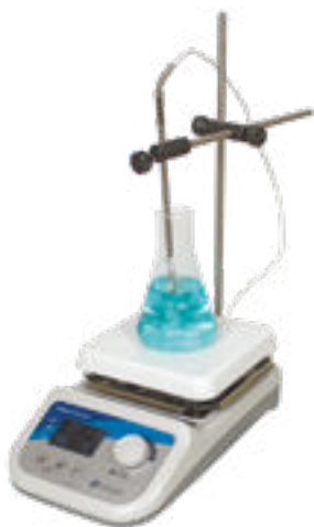
STEGLER HS-Pro DT

Цифровая лабораторная магнитная мешалка STEGLER HS-Pro DT с подогревом до 380 °С и внешним температурным датчиком предназначена для перемешивания жидкостей различной степени вязкости со скоростью до 1500 об/мин.