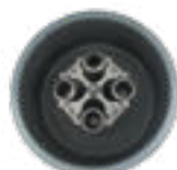
4 × 100 мл