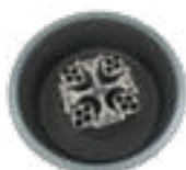
16 × 15 мл