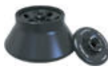
Ротор 8 \times 15 мл (13 000 об/мин, 17 570 g)