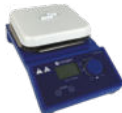
STEGLER HS-Pro Digital