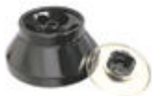
Ротор 6 \times 50 мл (12 000 об/мин, 14 750 g)