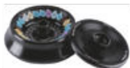
Ротор 24 × 1,5/2 мл (16 000 об/мин, 23 470 g)