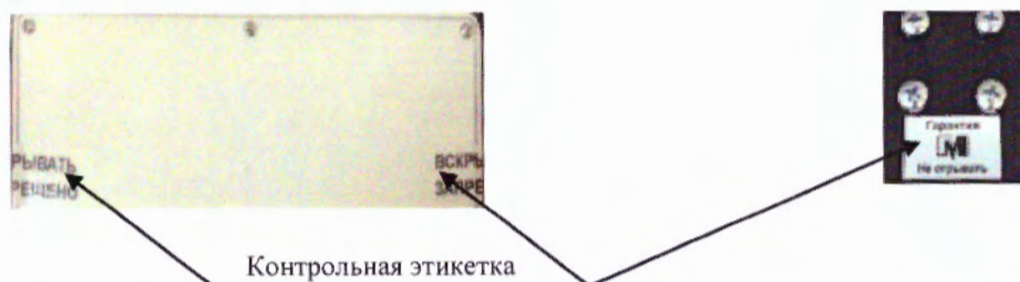
Рисунок 2 - Схема пломбирования от несанкционированного доступа

Серийный номер и буквенно-цифровое обозначение модификации приведено на маркировочной табличке в виде наклейки, расположенной на задней стенке основания весов. Пример маркировки приведен на рисунке 3.