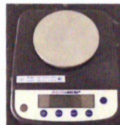
Весы серии ВТ