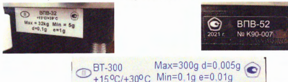
Рисунок 3 – Пример маркировки весов