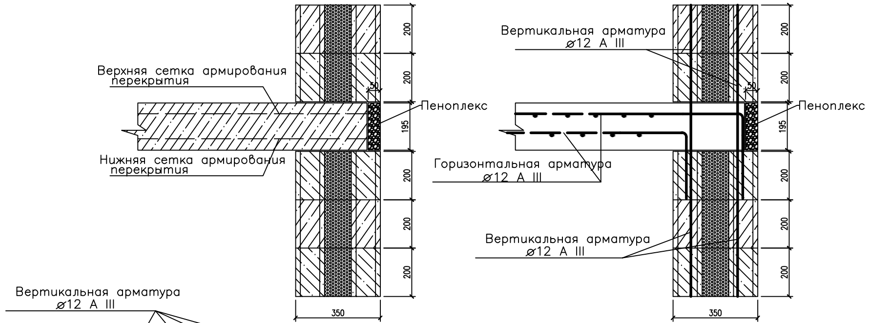
Схема армирования стыков перекрытия с ограждающими стенами. Вариант 2