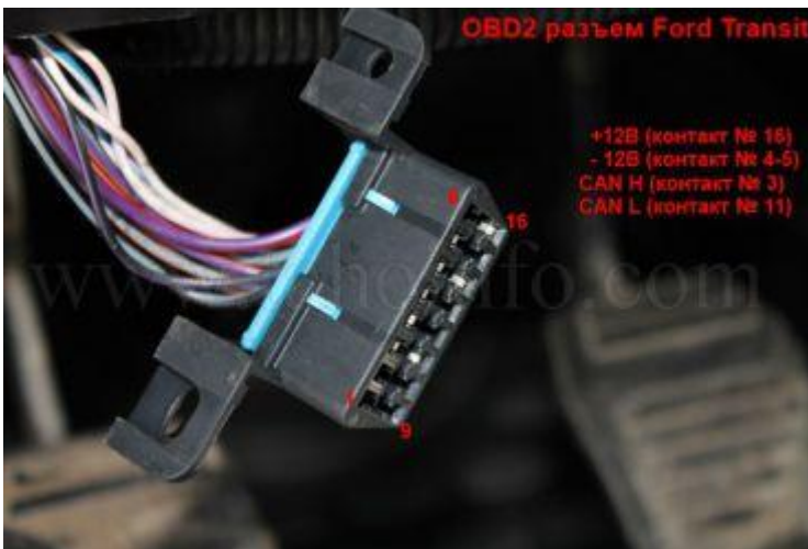
Схема подключения CAN to SPEED adaptor на автомобиль Ford Transit