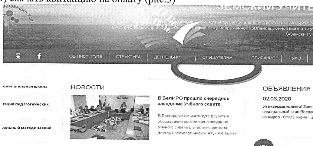
Рис.1 Раздел «Слушателям»