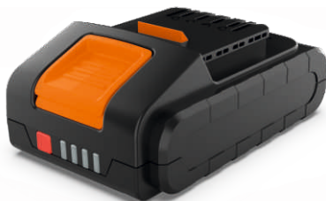
Аккумуляторная батарея модель AS202 20В /2,5Ач