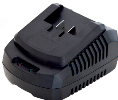
Зарядное устройство модель AC202 20В /2А