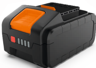
Аккумуляторная батарея модель AS204 20В /4Ач