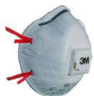
3M™ Противоаэрозольная Фильтрующая Полумаска 8132