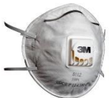
3M™ Противоаэрозольная Фильтрующая Полумаска 8112