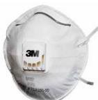
3M™ Противоаэрозольная Фильтрующая Полумаска 8122