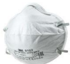
3M™ Противоаэрозольная Фильтрующая Полумаска 8102