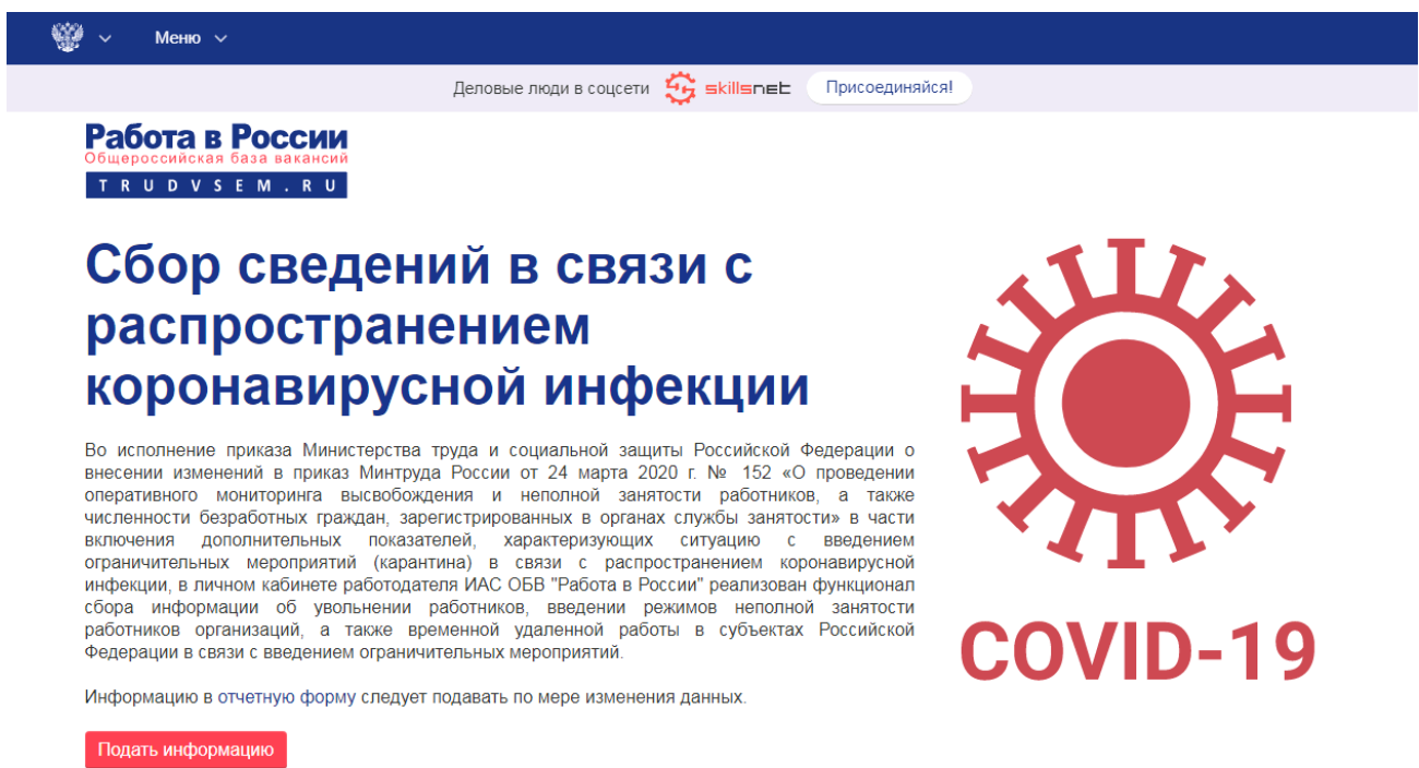
Рис. 2. Информационная страница