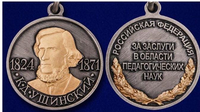
Медаль им. К.Д. Ушинского

Обучение должно развивать умственные силы и способности учеников, а также давать необходимые в жизни познания.