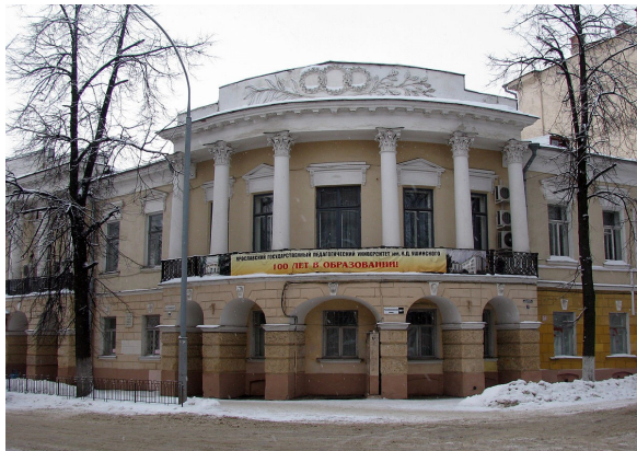
Ярославский государственный педагогический

«Важнейшим условием, повышающим работу памяти, является здоровое состояние нервов, для чего необходимы физические упражнения»