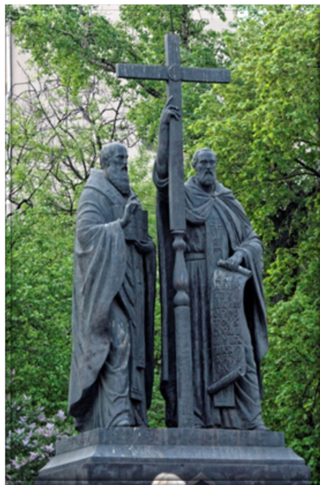
ПАМЯТНИК СВЯТЫМ РАВНОАПОСТОЛЬНЫМ КИРИЛЛУ И МЕФОДИЮ. СЛАВЯНСКАЯ ПЛОЩАДЬ, Г. МОСКВА,

МБУ «МПОБ» МЦБ имени А.Апужина Адрес: г. Болхов, ул. Ленина, д.18 Режим работы: с 9.00 до 16.00 Выходной: Воскресенье E-mail: bibliobolhov@mail.ru Сайт: http://bibliobolhov.nethouse.ru/ Тел. 84864023444, 8486402 3142