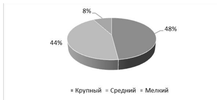
Рис. 2. Распределение размера почерка левшей у учащихся 3 Б класса школы № 288 на констатирующем этапе эксперимента