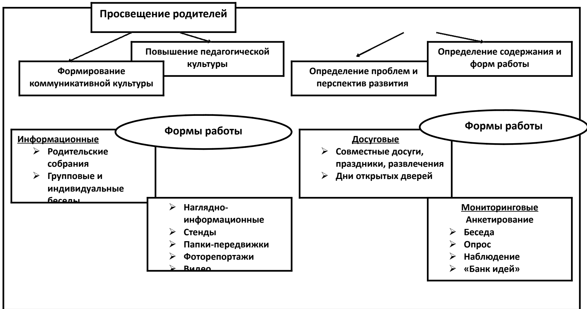
Модель взаимодействия с семьей