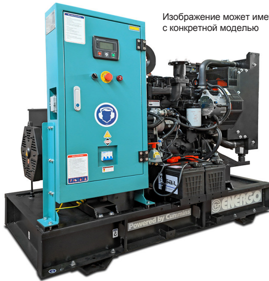
Изображение может иметь различия с конкретной моделью