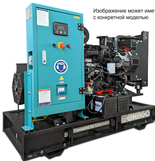
Изображение может иметь различия с конкретной моделью