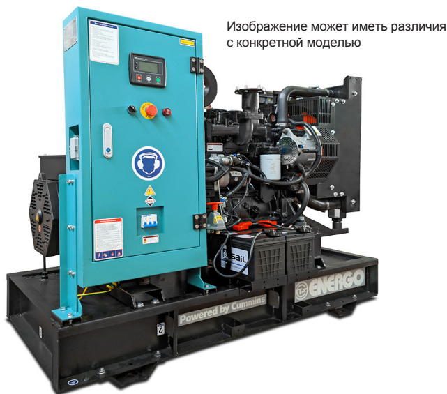
Изображение может иметь различия с конкретной моделью