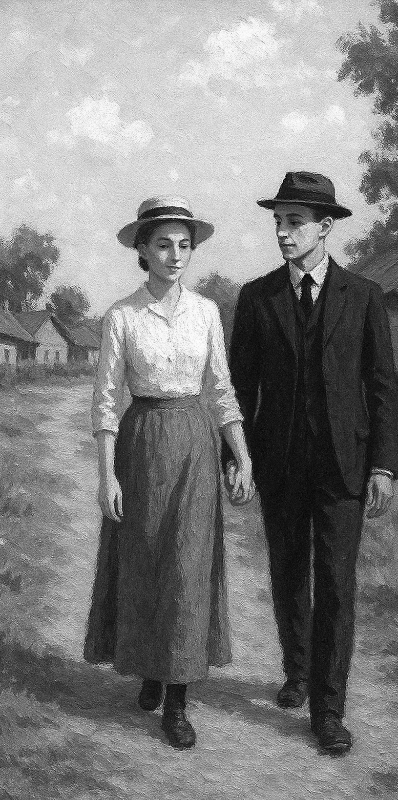
Так могли гулять по селу Иван Бунин и Вера Муромцева**