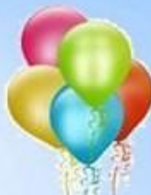
Пять воздушных шаров