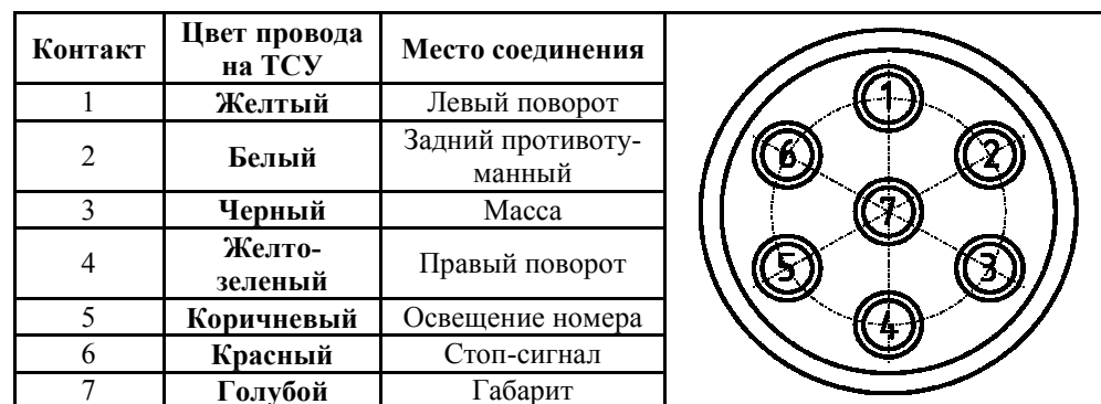
СХЕМА МОНТАЖА ТСУ