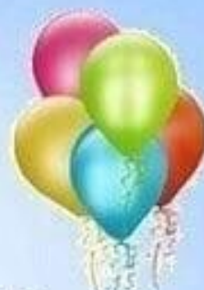
Пять воздушных шаров