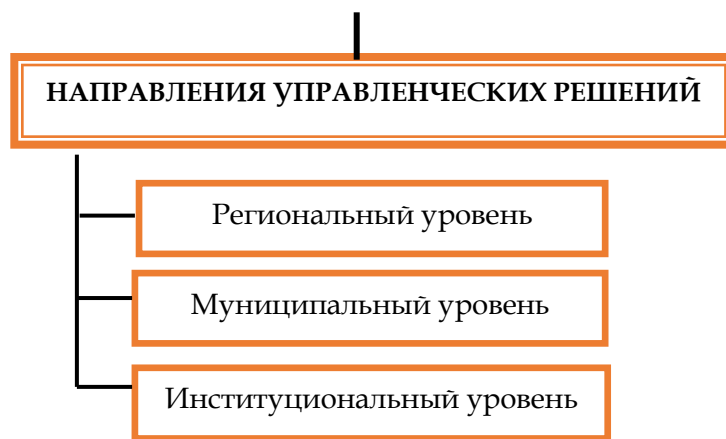
Рисунок 2. Структура региональной модели оценки качества общего образования

Обобщенная характеристика региональной модели оценки качества общего образования представлена в приложении 1.