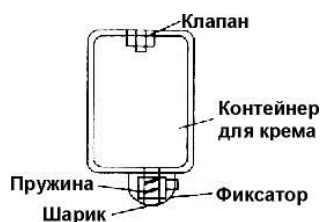
Рис.2. Контейнер для крема