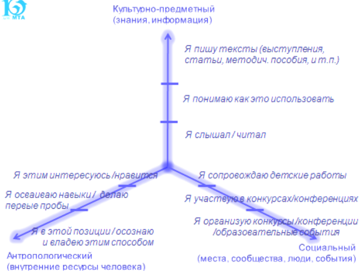
Рис. 1. Схема ресурсного расширения (Т.М. Ковалёва)