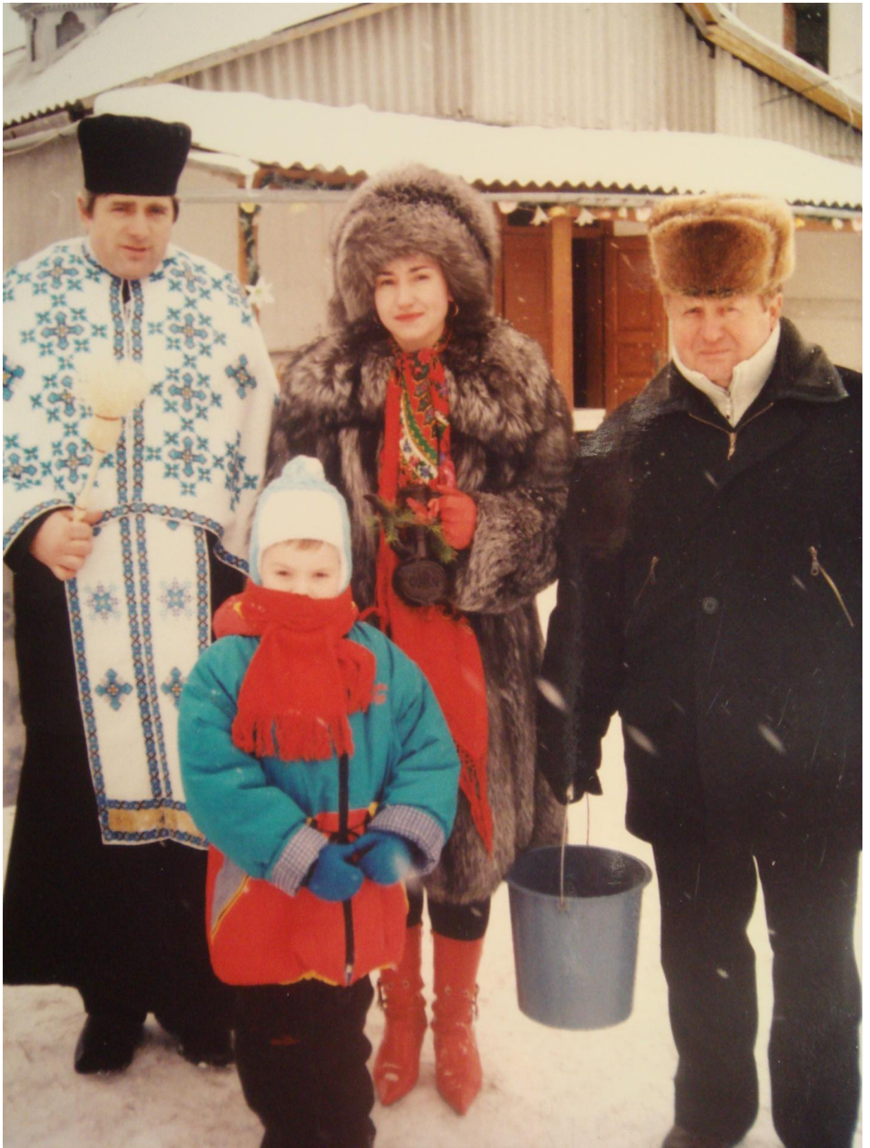
19 января 2006 года. Ярдань или Крещение. Мы с сыном ходили на службу и за водичкой в церковь.