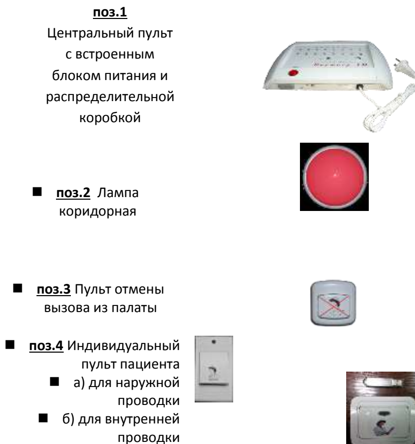
Таблица 2. Сигнализация палатно-вызывная "Партнер-1М". Внешний вид и состав.

4.8 Схема электрическая принципиальная представлена на Рис 1.