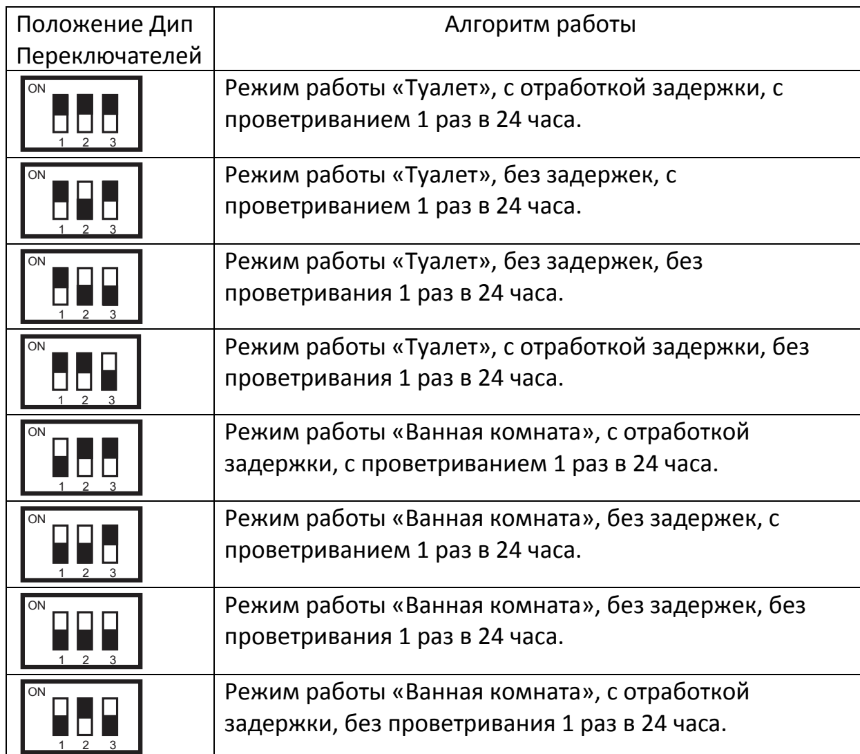
Таблица вариантов положения переключателя и алгоритмы работы.