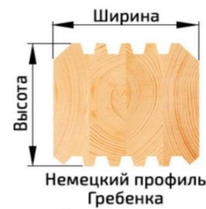
Немецкий профиль Гребенка