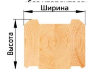
Финский профиль «под утеплитель»