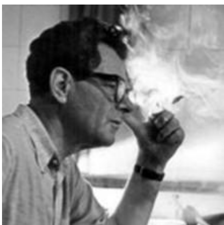
Макс Альперт (1899-1980)

Из тысяч фотокорреспондентов 62 стран-участниц Второй мировой именно советские фотографы оставили самые пронзительные свидетельства войны. Их имена прочно вошли в историю не только отечественной фотографии, но и в историю советской журналистики. Смелость, непоколебимая вера в победу и самоотверженность, - вот что отличало каждого из них, когда они добровольцами шли на фронт и под пулями создавали фотолетопись страны. Фотографы войны... у них особое место среди коллег. И дело не только в том, что они, в отличие от остальных, по-настоящему рискуют жизнью. Просто военный фотограф видит изнанку жизни и смерти, видит подлинных людей. А еще он может оказаться свидетелем Истории. Особенно если речь о самой тяжелой войне, которую фотограф прошел от первого до последнего дня.