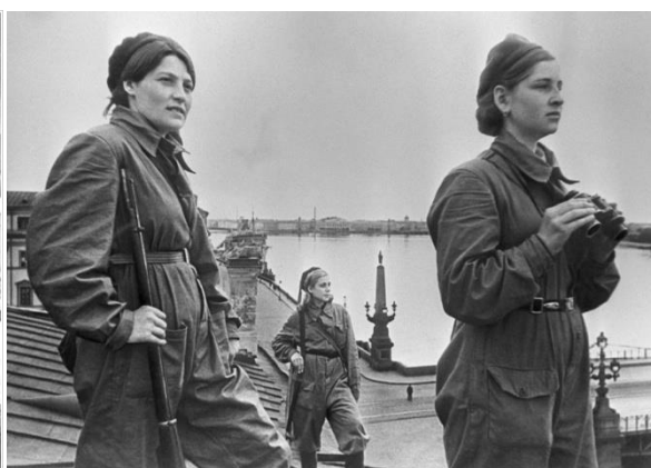
Девушки-бойцы МПВО несут боевое дежурство на крыше дома № 4 по улице Халтурина в Ленинграде. 1942 год.