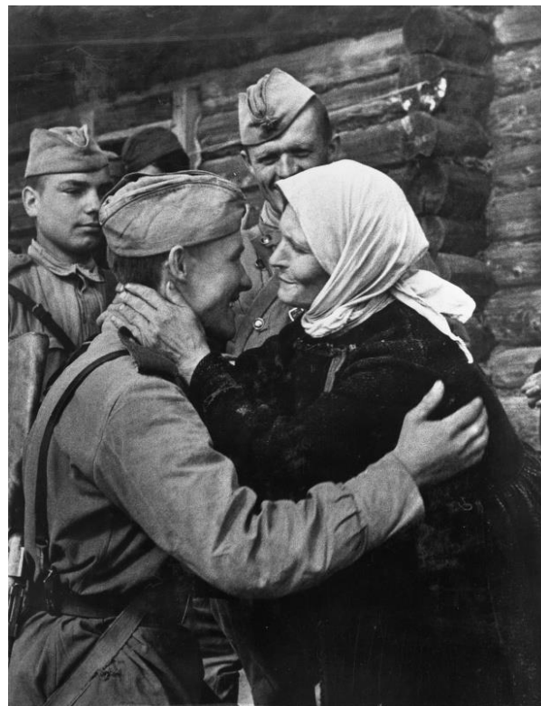
Советский солдат встретился с матерью. Оригинальное название фото: «Здравствуй, сынок!». Лето 1943 года.