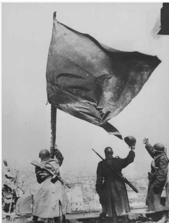
Советские солдаты со знаменем на крыше Рейхстага.

с Японией. В послевоенное время — корреспондент фотохроники ТАСС, журнала «Советский Союз», издательства «Планета».