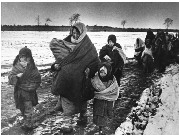
Советские женщины и дети возвращаются домой. Авторское название фото — «В родное село». Макс Альперт, 1943 год

Считается одним из родоначальников советской серийной репортажной фотографии. Заслуженный работник культуры РСФСР (1966).