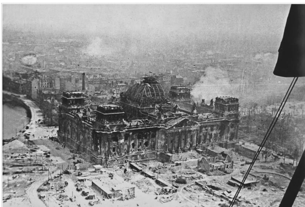
Знамя Победы на поверженном Рейхстаге 1 мая 1945 года. Снимок сделан военным корреспондентом газеты «Правда» В.А. Теминым с борта самолета По-2.

Награжден тремя орденами Красной Звезды, орденами Отечественной войны I и II степеней, медалями. Заслуженный работник культуры РСФСР.