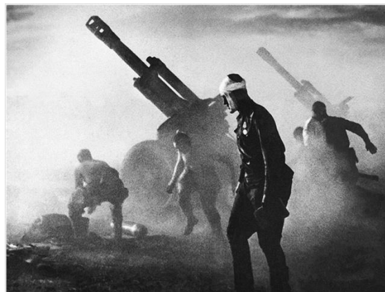
Батарея 152-мм гаубиц Д-1 образца 1943г. ведет огонь по обороняющимся немецким войскам