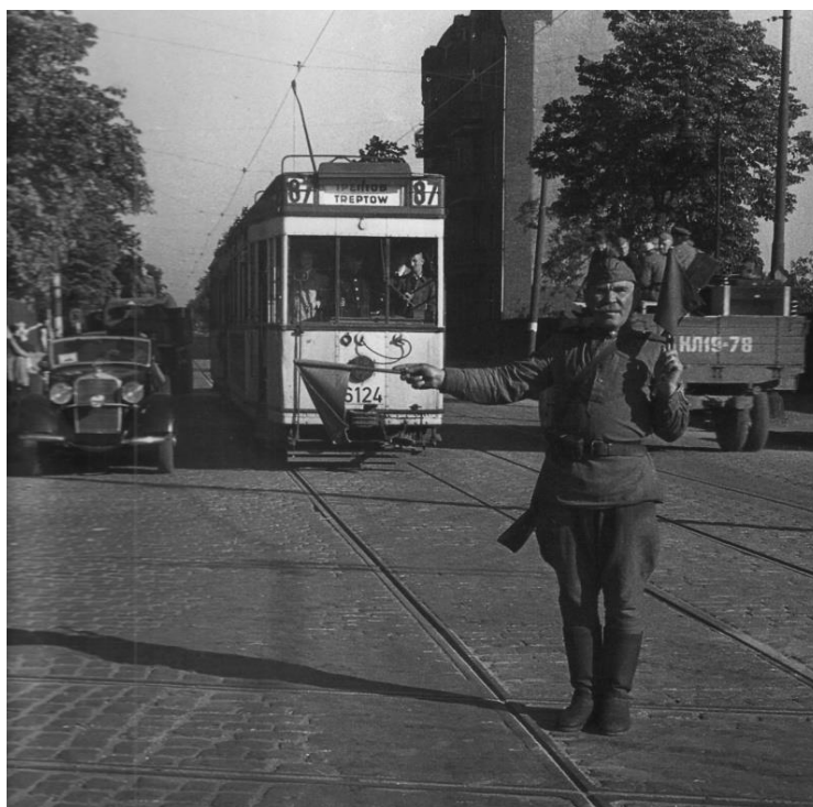
Пожилый советский солдат-регулировщик на перекрестке улиц Берлина.