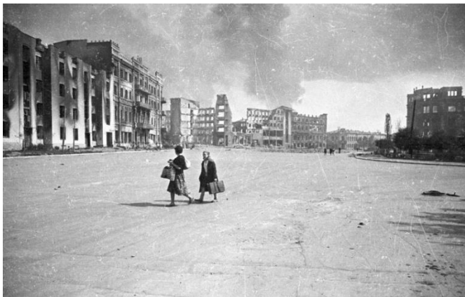
Две советские женщины идут по площади Павших борцов в Сталинграде. 1943 год

После войны, работая в ТАСС, Э. Евзерихин преподавал основы искусства фотографии в Заочном Народном Университете искусств, выступал с лекциями по стране.