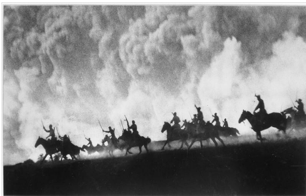
Атака советской конницы.

Снимал отступление в Белоруссии, бои под Смоленском, битву за Москву, на Курской дуге, освобождение Литвы, наступление в Восточной Пруссии. Снимал капитуляцию немецких войск в Восточной Пруссии и на Балтике. С 1945 года Михаил Савин работал фотокорреспондентом в журнале «Огонек».