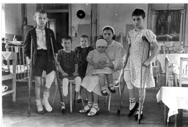
Раненые дети в палате Ленинградского государственного педиатрического института.