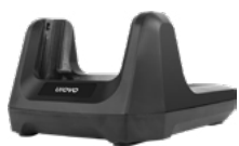
Зарядная станция (Cradle)