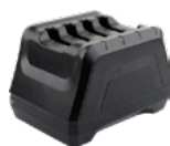
4-х зарядная станция для батарей