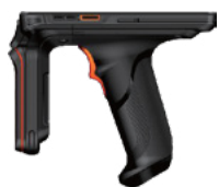
RFID - версия