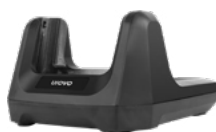
Зарядная станция (Cradle)