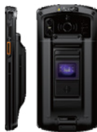
Фингерпринт - версия