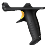
Сканер штрих-кода с триггером