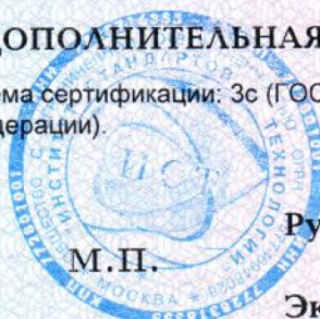
Схема сертификации: Зс (ГОСТ Р 53603-2020 Оценка соответствия. Схемы сертификации продукции в Российской Федерации).