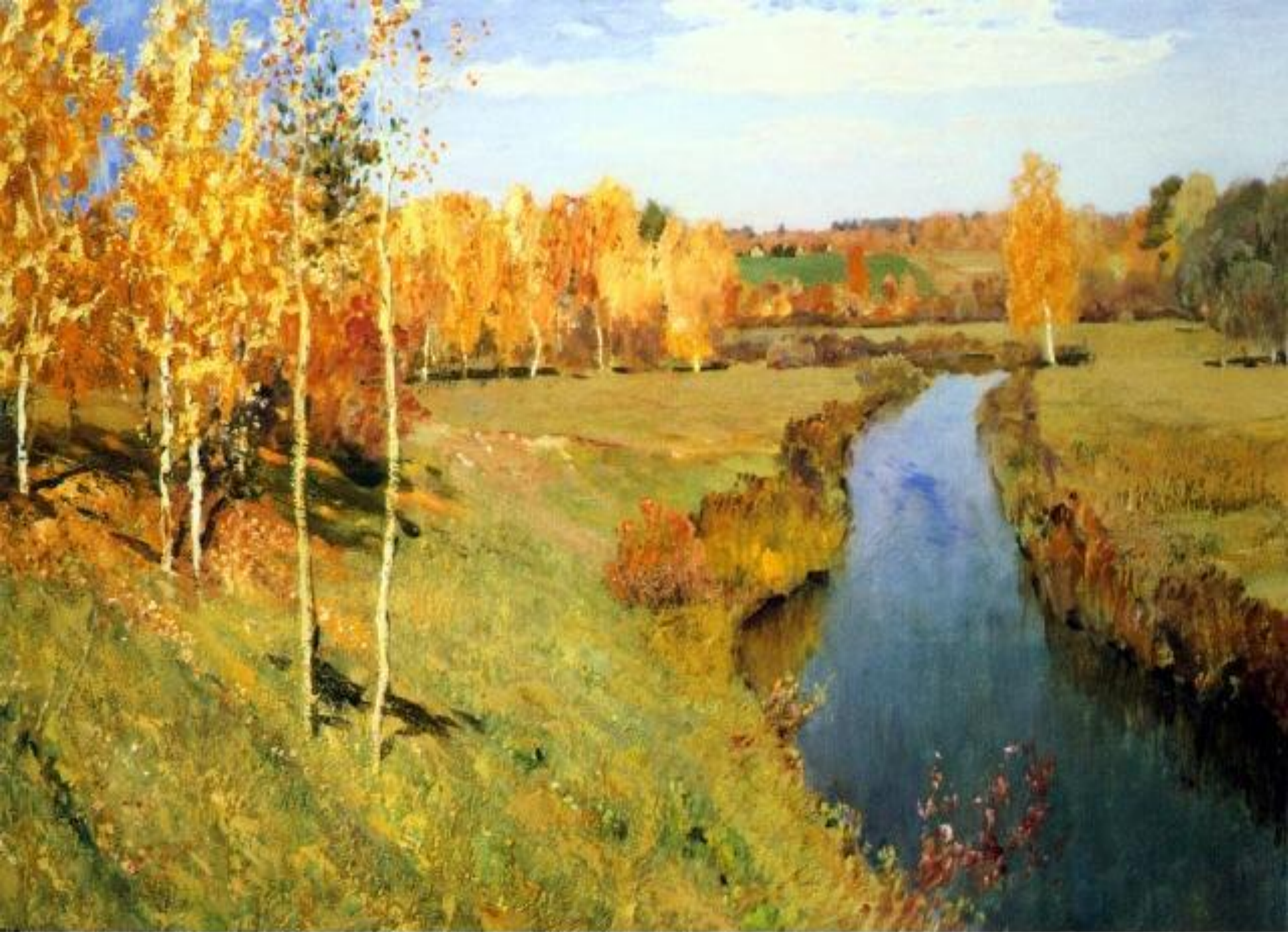
Isaac Ilich Levitan "Golden Autumn" 1895