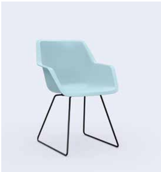
800.6000 + fa800-08