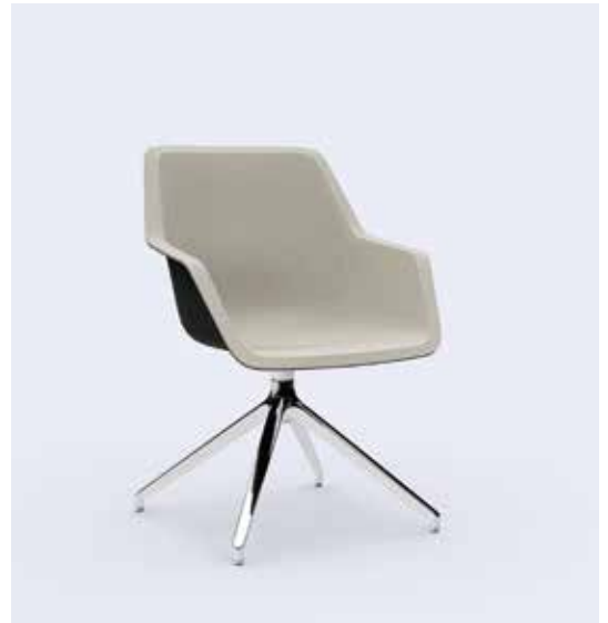
800.5000 + fa800-06 + ps200-23