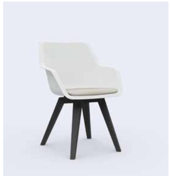
800.7000 + ge800-11 + ps100-23