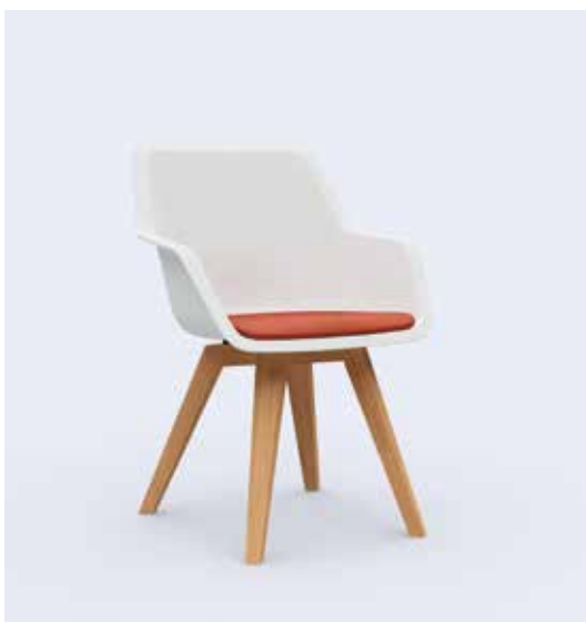
800.7000 + ps100-23