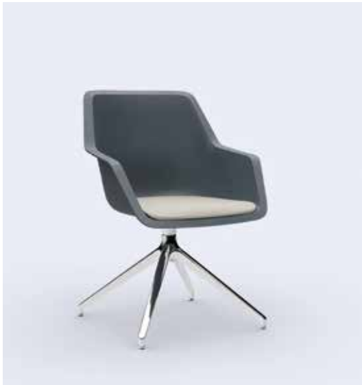
800.5000 + fa800-06 + ps100-23