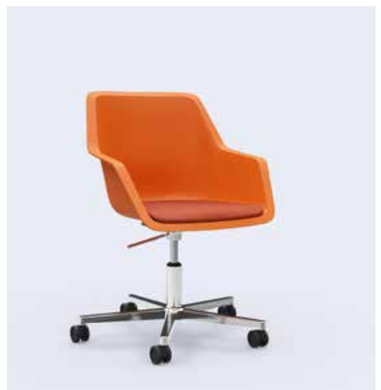
800.9000 + fa800-07 + ps100-23