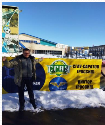
Фото со спортивных событий