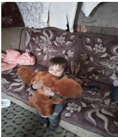
Фото с благотворительных акций в Саратовской области