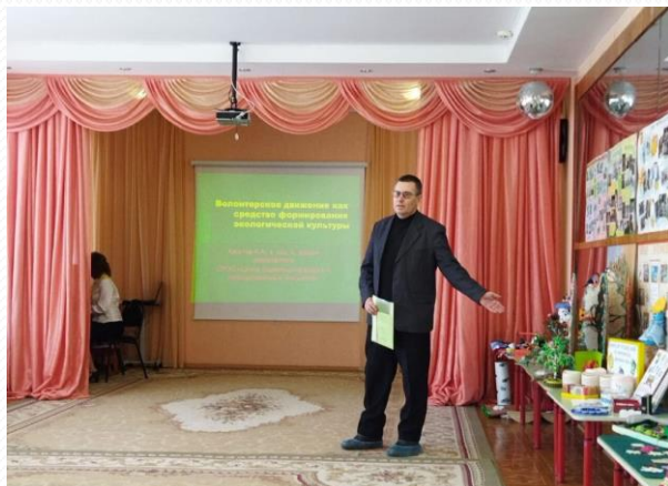
Фото с конференций, семинаров, форумов в Саратовской области