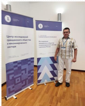
Фото с международных летних школ