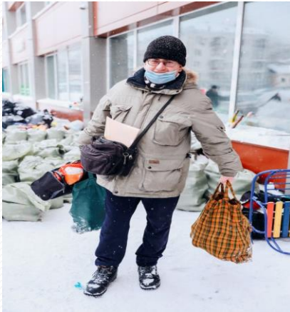
Фото с экологических мероприятий