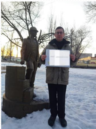
Фото с правозащитных акций