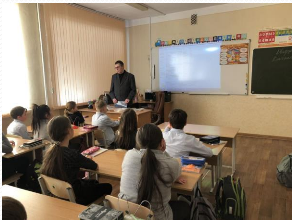
Фото с экологических мероприятий в Саратовской области