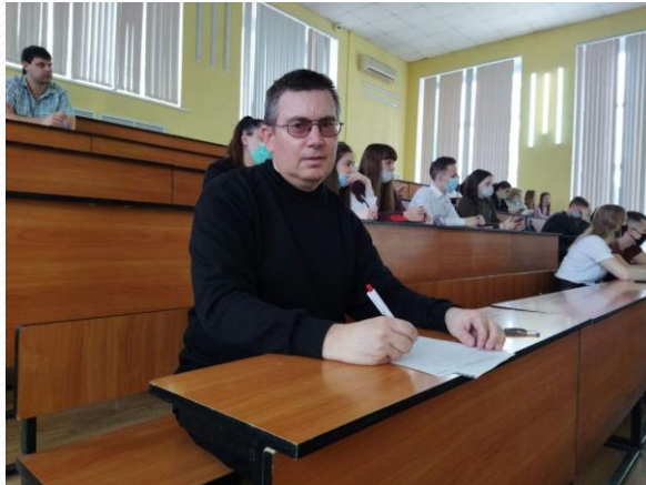
Фото с образовательных и праздничных мероприятий в Саратове