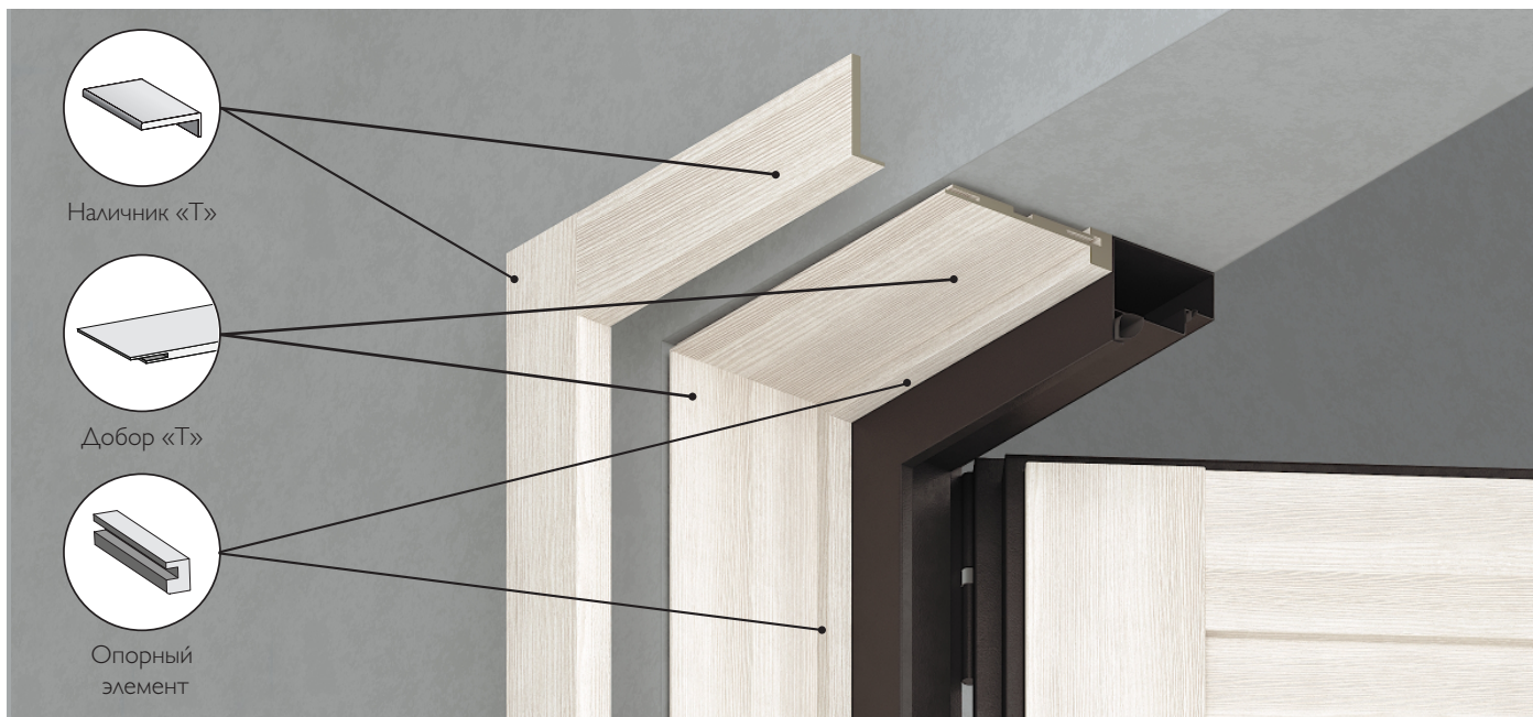
СХЕМА СОЕДИНЕНИЯ ДОБОРОВ С ИСПОЛЬЗОВАНИЕМ ШПОНКИ