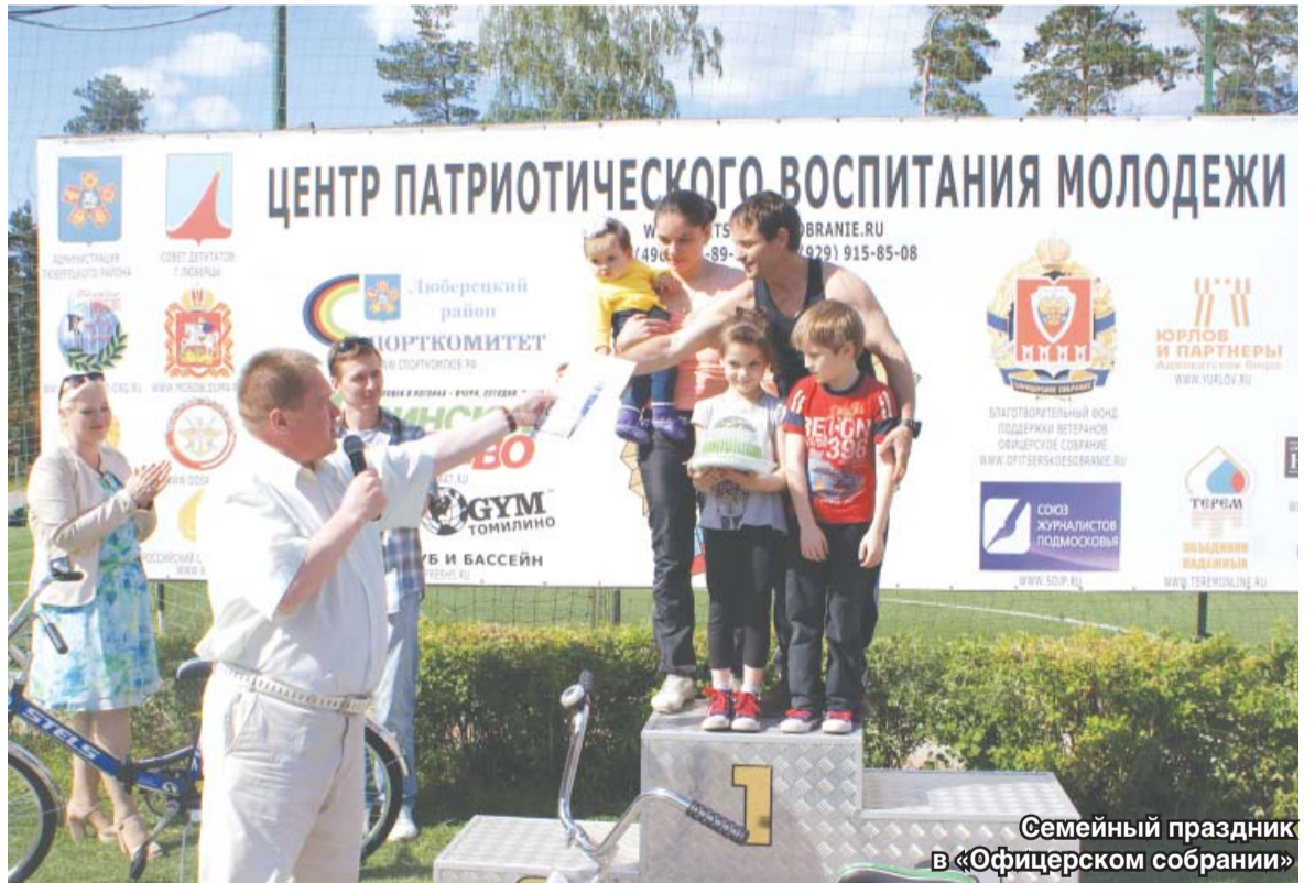
Семейный праздник в «Офицерском собрании»

– Конечно, хочется, прежде всего, пожелать счастья! Успе-