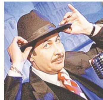
Заслуженный артист России Тимур МИРОНОВ