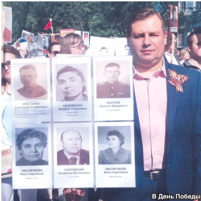
В День Победы