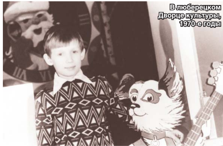
В люберецком Дворце культуры, 1970-е годы

Богдан КОЛЕСНИКОВ Фото автора и из архива А.П. Мурашкина