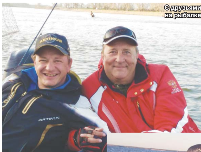
С друзьями на рыбалке

скором времени будет передано в муниципальную собственность. В настоящее время в Доме пионеров успешно работают различные кружки для наших юных земляков.