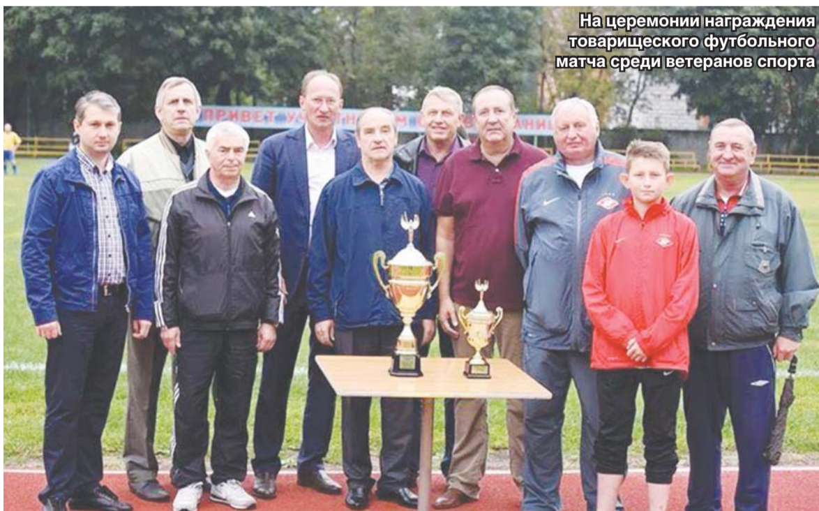
На церемонии награждения товарищеского футбольного матча среди ветеранов спорта

Приём населения депутат ведёт по адресу: г.о. Люберцы, пос. Томилино, ул. Гоголя, д. 19 в первый вторник месяца с 16.00 до 18.00