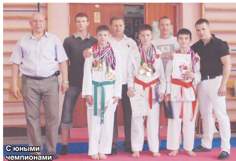
С юными чемпионами

В 2009 году жители избрали меня депутатом люберецкого городского Совета, и все эти восемь лет я стараюсь работать во благо наших жителей.