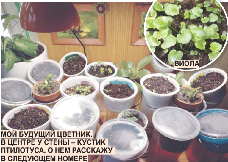
МОЙ БУДУЩИЙ ЦВЕТНИК. В ЦЕНТРЕ У СТЕНЫ – КУСТИК ПТИЛОТУСА. О НЕМ РАССКАЖУ В СЛЕДУЮЩЕМ НОМЕРЕ

Весна еще далеко, а цветоводы уже должны подумать о том, какие цветы в новом сезоне могут украсить их клумбы. Зимой можно посадить однолетники, двулетники и многолетники, которые весной подрастут и зацветут уже в этом сезоне.