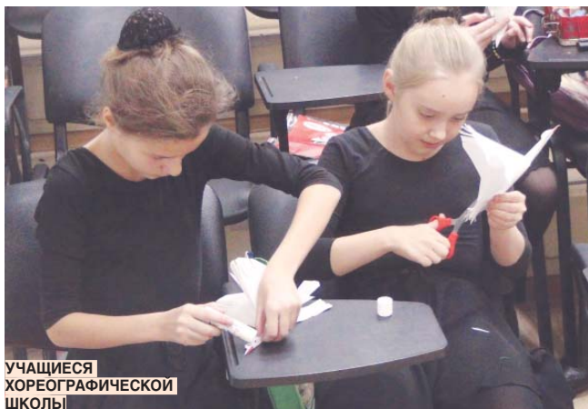
УЧАЩИЕСЯ ХОРЕОГРАФИЧЕСКОЙ ШКОЛЫ

22 октября – «День белых журавлей». Этот праздник известен не только в России, но и далеко за её пределами. Как и благодаря кому появился праздник, я вам напомню. Всем хорошо знакомо имя Народного поэта Дагестана, прозаика, публициста, переводчика, лауреата многих премий – Расула Гамзатова. В 1923 году в Дагестане, в горном селении Цада, родился мальчик Расул. Его отец Гамзат Цадаса писал стихи и басни, переводил на аварский произведения русских классиков, в том числе А.С. Пушкина. Расул начал писать стихи рано. Его первым наставником стал отец. После окончания Аварского педагогического училища Расул работал в школе, во время войны – на радио, печатался во фронтовых газетах. Материалы подписывал своей фамилией Цадаса, но потом взял псевдоним от имени отца Гамзата. В 20 лет в 1943 году вышел его первый сборник стихов на аварском языке, национальном языке аварцев, одного из народов Кавказа. В этот сборник «Пламенная любовь и жгучая ненависть» вошли стихи о войне. Гамзатов писал: «Если бы не было русского языка, народы Дагестана перестали бы понимать друг друга. Если бы не было русского языка, Расул Гамзатов остался бы поэтом одного ущелья».