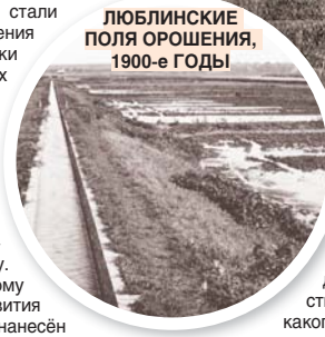
ЛЮБЛИНСКИЕ ПОЛЯ ОРОШЕНИЯ, 1900-е ГОДЫ