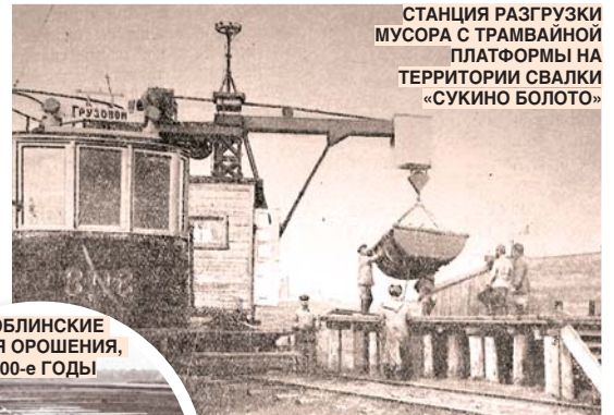
СТАНЦИЯ РАЗГРУЗКИ МУСОРА С ТРАМВАЙНОЙ ПЛАТФОРМЫ НА ТЕРРИТОРИИ СВАЛКИ «СУКИНО БОЛОТО»

Фабрики конкурировали с дачами ещё до того, как в эти края хлынули потоки испорченных. Уже в 1840 году очевидец описывал будущие Текстильщики, в кото-