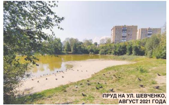
ПРУД НА УЛ. ШЕВЧЕНКО, АВГУСТ 2021 ГОДА

В настоящее время полным ходом идёт строительство многоквартирных домов на Птицефабрике. Ранее было известно, что в микрорайоне в четыре очереди планируют снести 20 малоэтажных жилых домов, в результате должны расселить более 900 семей. Будет ли это реализовано – непонятно до сих пор. Застройщик ни шатко ни валко ведёт работу по переселению жителей, правда, у людей в ходе такой работы появляется очень много вопросов и разногласий с коммерсантами. За помощью в их решении ко мне обращаются жители Птицефабрики. Мы с моими помощниками стараемся разобраться в возникших сложностях и помочь в отстаивании прав. Между тем строительные работы вдоль Рязанского шоссе продолжаются, три дома