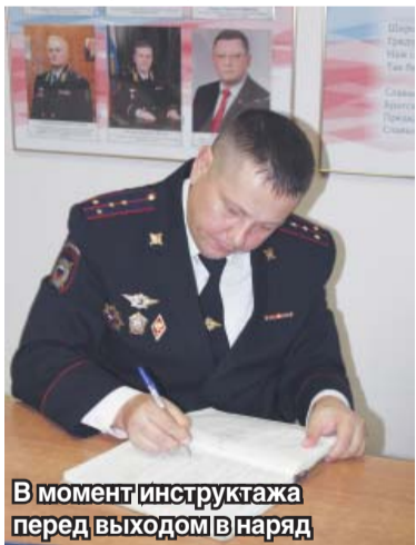
В момент инструктажа перед выходом в наряд

Ежедневно сотрудники ППС выходят на борьбу с преступностью. Помимо патрулирования города, нарядам приходится выезжать по срочным вызовам, причины которых могут быть разными. Самое безобидное – хулиганство, когда пьяная компания шумит в подъезде или под окнами дома. Но бывает, что сотрудники ППС сталкиваются с преступниками лицом к лицу, принимая огонь на себя. Поэтому каждый день патрульные вынуждены подвергать себя опасности во имя порядка и спокойствия мирных граждан.