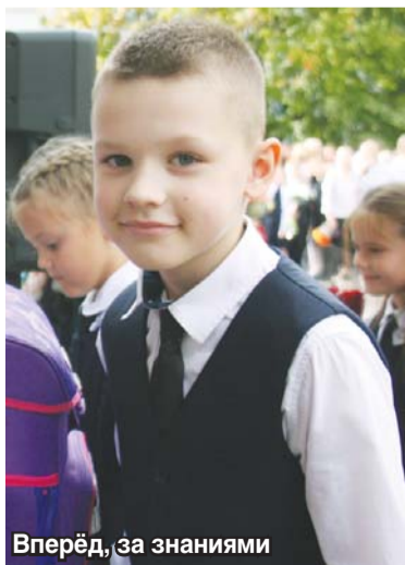
Вперёд, за знаниями

Кроме того, школьникам предлагается широкий спектр дополнительных образовательных услуг по художественной,