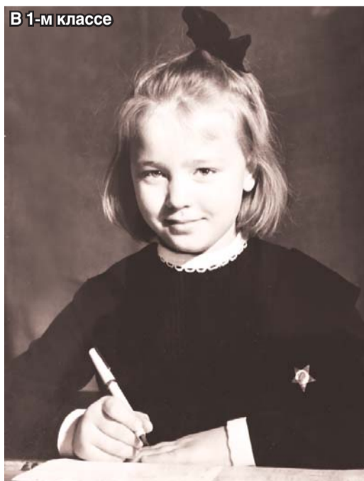
В 1-м классе