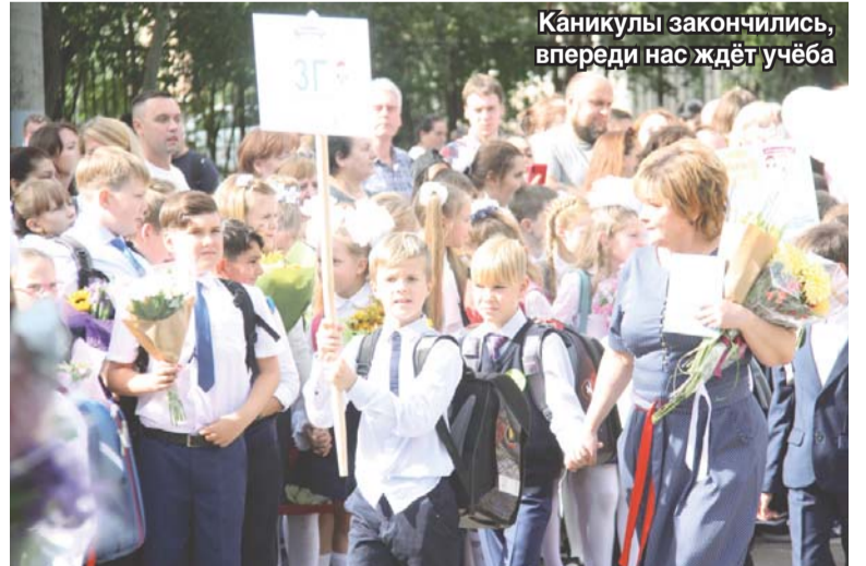
Каникулы закончились, впереди нас ждёт учёба