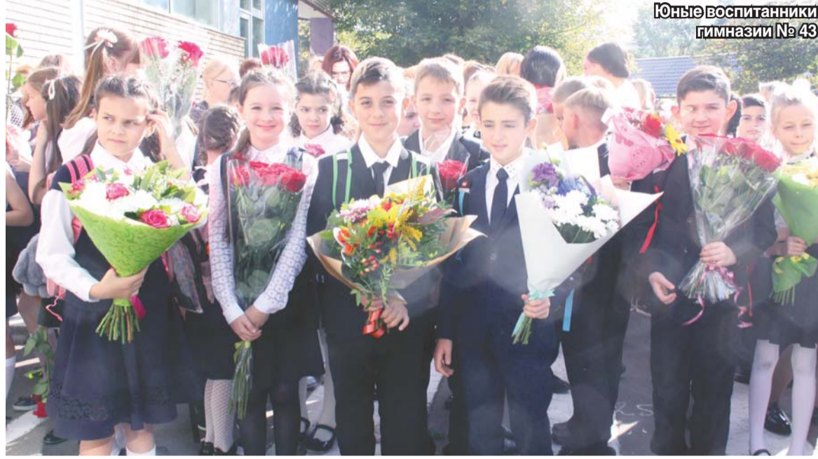
Юные воспитанники гимназии № 43

Во всех школах городского округа Люберцы в понедельник прошёл праздник Первого звонка. За парты сели почти 34,5 тысяч ребят, 4 460 из них – первоклашки.