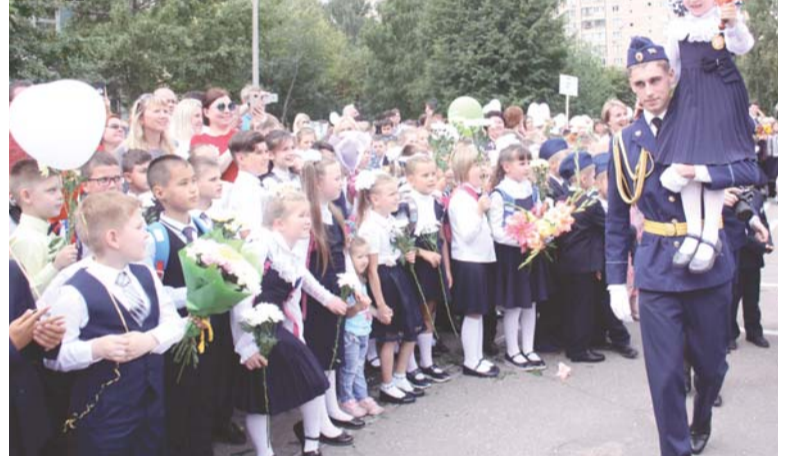
Звонит Первый звонок в Кадетской школе

физкультурно-спортивной, технической, естественнонаучной и социально-педагогической направленности. В лицее будет функционировать более 30 секций дополнительного образования.