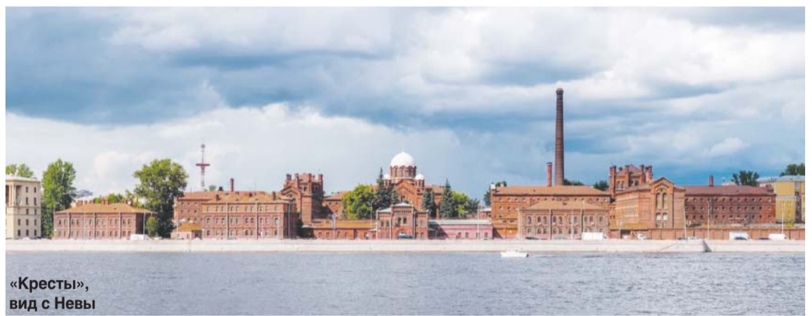
«Кресты», вид с Невы