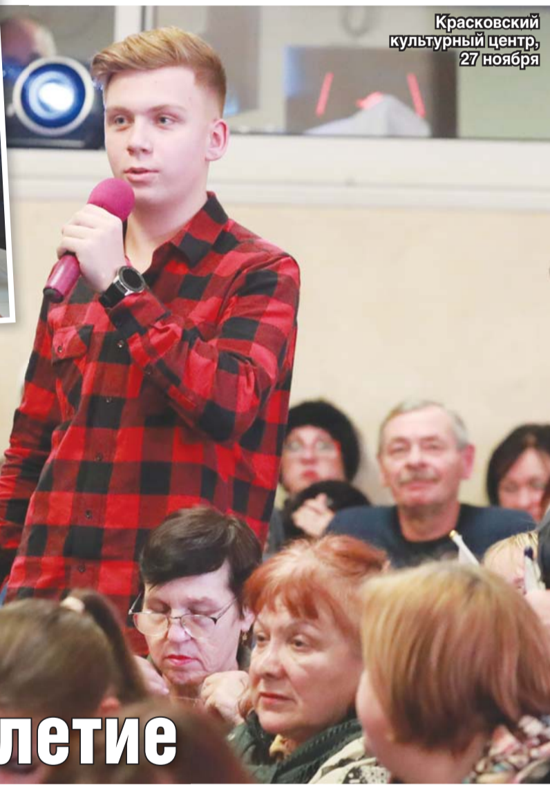
Красковский культурный центр, 27 ноября