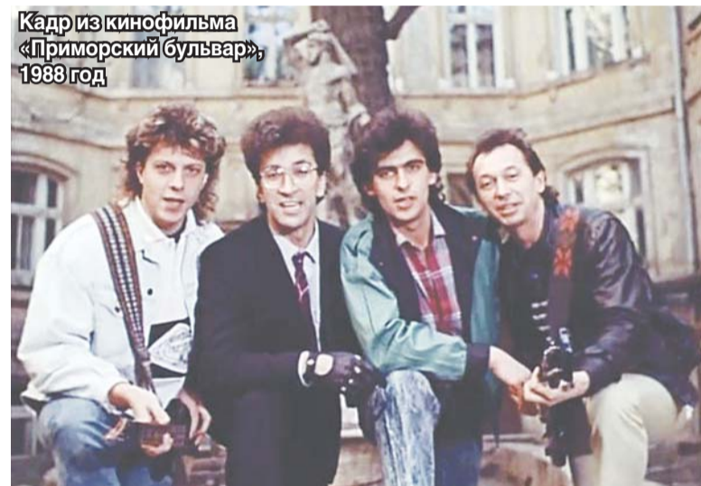
Кадр из кинофильма «Приморский бульвар», 1988 год

– Я не так много пишу песен, чтобы их продавать. (Улыбается). Несколько вещей, например, приготовил для Аллы Пугачёвой.