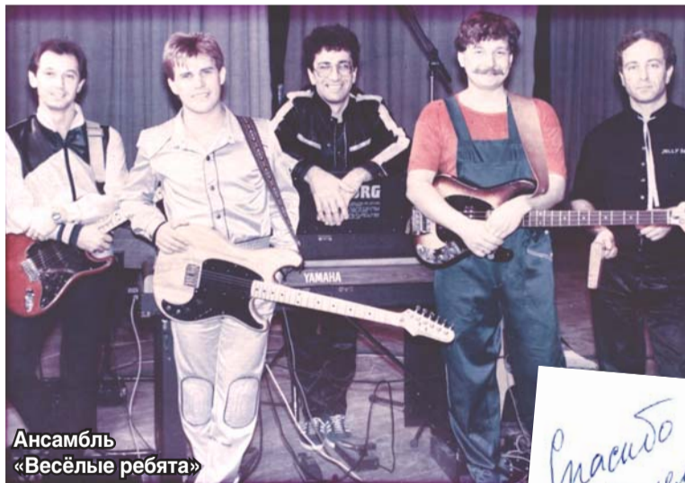
Ансамбль «Весёлые ребята»

– Да, люберецкие стали первыми зрителями, кто услышал эту песню. Значит, концертный тур можно официально считать открытым у вас, в прекрасном городе Люберцы.