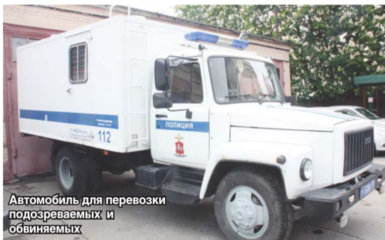
Автомобиль для перевозки подозреваемых и обвиняемых

– В основном это граждане из других регионов России и стран Средней Азии. Жители городского округа Люберцы законопослушны, они попадают к нам реже.