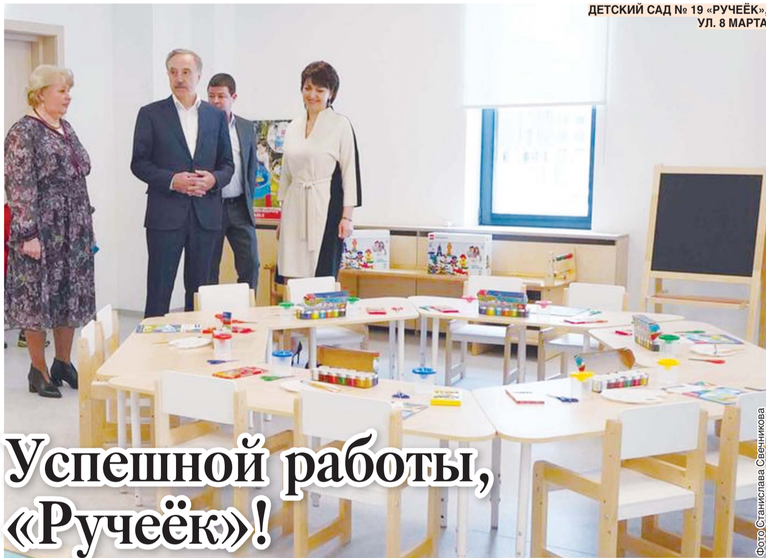
ДЕТСКИЙ САД № 19 «РУЧЕЁК», УЛ. 8 МАРТА