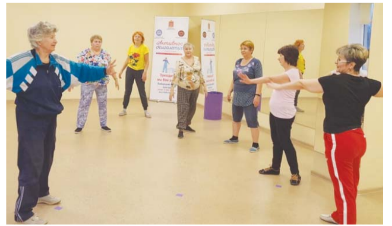
Полоса подготовлена по материалам ЛЮБЕРЕЦЫ.РФ

Запись осуществляется с понедельника по пятницу с 9.00 до 18.00 по телефону: 8 (925) 459-92-19. Приглашаются все желающие в клуб «Активное долголетие» по адресу: улица Куракинская, дом 5.