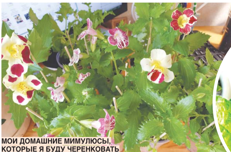
МОИ ДОМАШНИЕ МИМУЛЮСЫ, КОТОРЫЕ Я БУДУ ЧЕРЕНКОВАТЬ

Мимулюсы появились у меня неожиданно. Осенью копалась на просторах всемирной паутины в надежде найти семена какого-нибудь домашнего цветочка. И неожиданно наткнулась на этого милушку. Мимулюс – это многолетнее травянистое растение, которое, при желании, можно выращивать и как домашний цветок на несолнечном подоконнике – растение довольно неприхотливо.