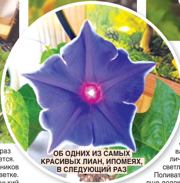
ОБ ОДНИХ ИЗ САМЫХ КРАСИВЫХ ЛИАН, ИПОМЕЯХ, В СЛЕДУЮЩИЙ РАЗ

большим количеством бутонов различных расцветок. И к середине мая у вас на участке будет красивейшая клумба.