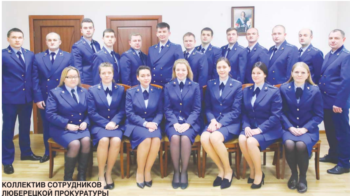
КОЛЛЕКТИВ СОТРУДНИКОВ ЛЮБЕРЕЦКОЙ ПРОКУРАТУРЫ

Прокуратуре России исполнилось 300 лет. Сегодня – это главный надзорный орган страны, который от имени государства контролирует исполнение законов всеми органами власти, компаниями и гражданами, а также защищает права всего общества в суде. С момента учреждения этого государственного института его структура, функции и задачи много раз менялись, однако он по-прежнему остается важнейшим элементом системы защиты прав граждан.