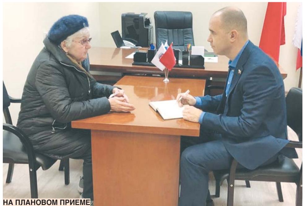
НА ПЛАНОВОМ ПРИЕМЕ

– Чего бы пожелали своим избирателям в наступившем 2022-м году?