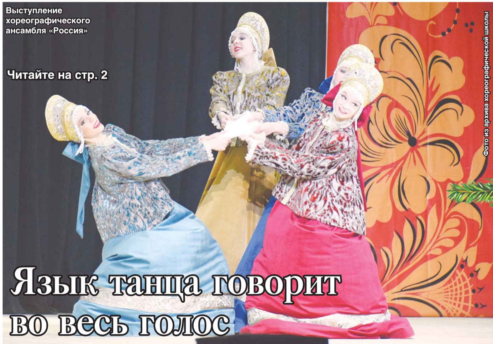
Выступление хореографического ансамбля «Россия»