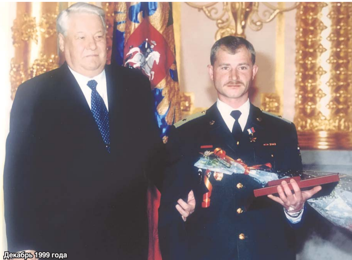
Декабрь 1999 года