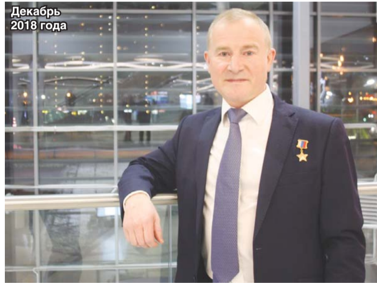
Декабрь 2018 года

полнота информации во время боя играла решающую роль).