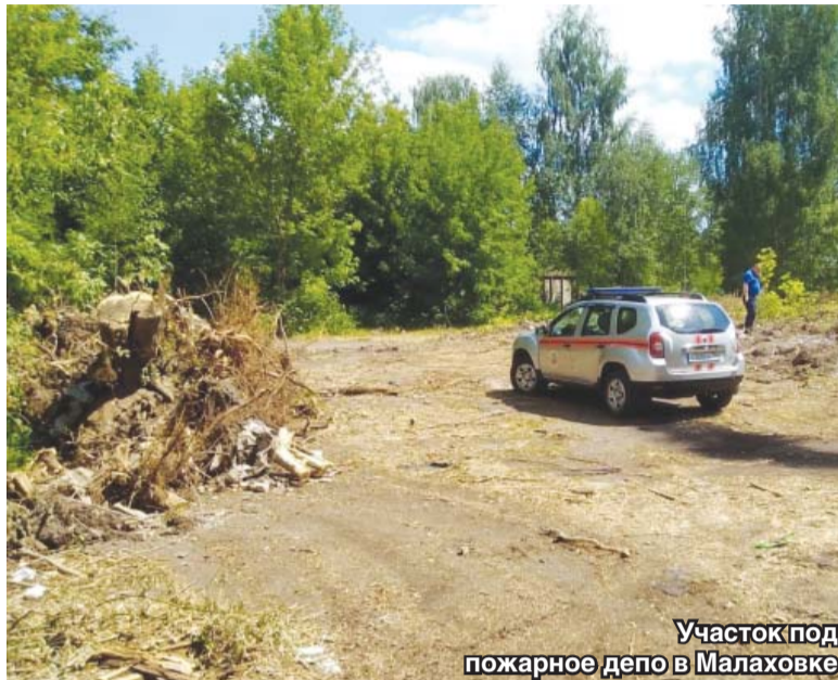
Участок под пожарное депо в Малаховке

В городском округе Люберцы могут появиться три дополнительных пожарных части. Об этом «ЛГ» рассказал начальник люберецкого территориального управления «Мособлпожспас» Олег Хатин.