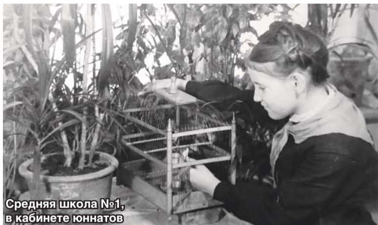
Средняя школа №1, в кабинете юннатов