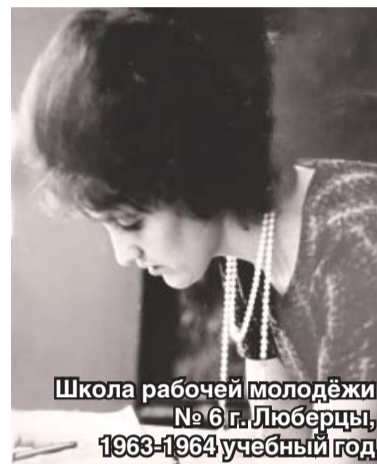
Школа рабочей молодёжи № 6 г. Люберцы, 1963-1964 учебный год