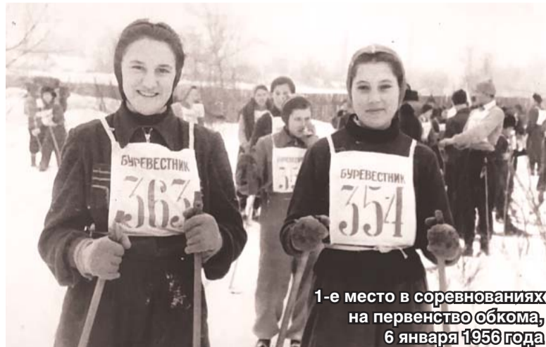
1-е место в соревнованиях на первенство обкома, 6 января 1956 года

Богдан КОЛЕСНИКОВ