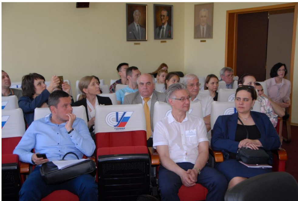
Участники конференции, 22 мая 2019г., 603 а.

Во второй половине дня работа осуществлялась в двух секциях.