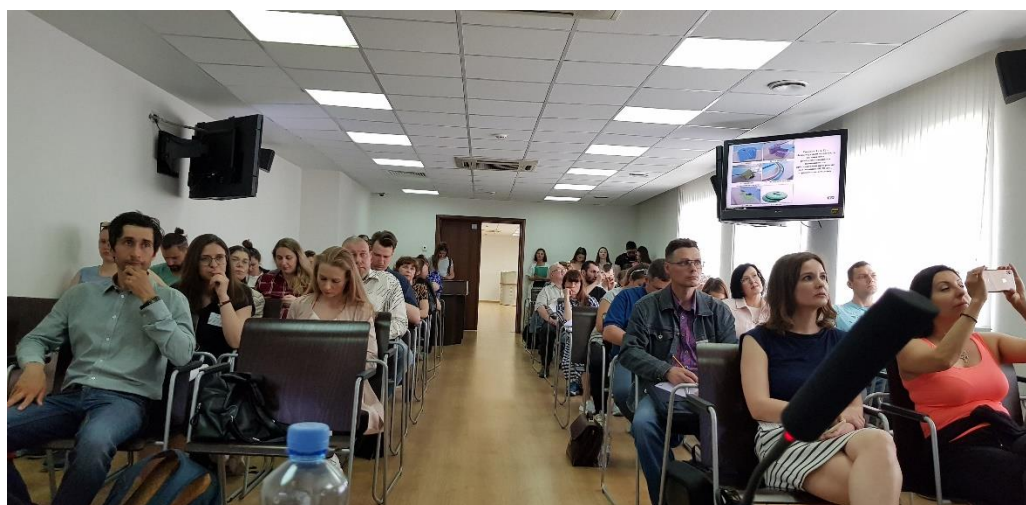
Участники конференции, секция «ЛФК и физическая реабилитация», 22 мая 2019 г., 702 ауд.