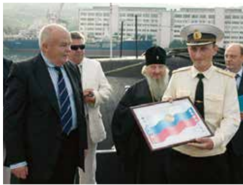
Академик вручает диплом Форума на Тихоокеанском флоте.