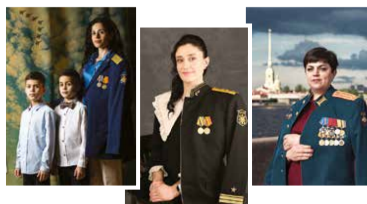
Фото из галереи открыток участниц фотопроекта «ЖЕНА ГЕРОЯ» — Санкт-Петербург